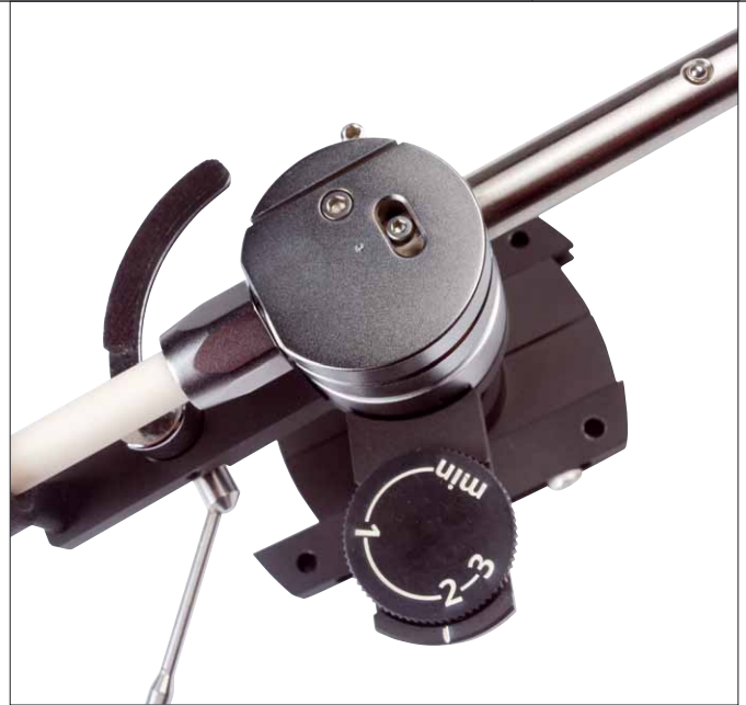
Das Antiskating wird seitlich per Rändelrad eingestellt

der Lagerblock des Arms sieht von außen vollkommen unschuldig aus und fühlt sich genau so an wie ein klassischer kardanisch gelagerter Tonarm. Eine Möglichkeit zur Azimutverstellung gibt's auch, nach Lösen einer Schraube oben auf dem Lagergehäuse kann das Armrohr verdreht werden. Ein Indikator zeigt dabei die Nullstellung an.