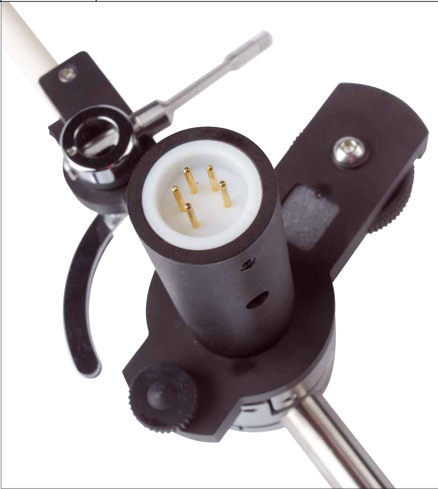
Von unten wird ein Anschlusskabel nach SME-Norm eingesteckt

schaft in der gewünschten Höhe. Mittels einer Rändelschraube kann die gewünschte Höhe vorgegeben werden, so dass sich die Einstellung nicht ändert, wenn der Schlitten verschoben wird. Ähnliches gilt für den Linn-Flansch. Auch hier hat der Konstrukteur die geimeinhin übliche unsägliche Madenschraube vermieden, die auf den Armschaft drückt und ihn unweigerlich verkratzt.