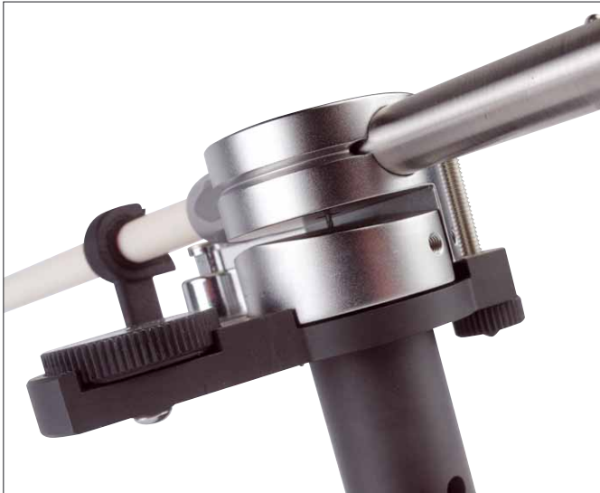
Im Lagerblock versteckt sich unter anderem das trickreiche Flexlager