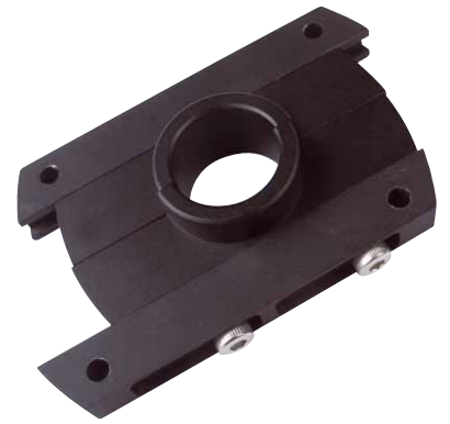
Die SME-„Schiebebasis“ erlaubt eine einfache Montage auf einer Vielzahl von Laufwerken