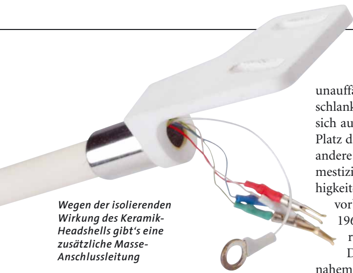
Wegen der isolierenden Wirkung des Keramik-Headshells gibt's eine zusätzliche Masse-Anschlussleitung

fälliges Maß an Klarheit und Transparenz erkennen. Unter dem Keramikheadshell wird der 230-Euro-Tonabnehmer gleich ein paar Klassen teurer. Und so staune ich nicht schlecht, mit welcher Inbrunst die Kombination Nick Caves düsteres Statement „Ghsteen“ reproduziert, wie energisch, emotional und getrieben der Australier hier zur Sache geht. Tonal gibt sich der Korf komplett unauffällig. Er zeichnet einen schön farbigen, aber weitgehend