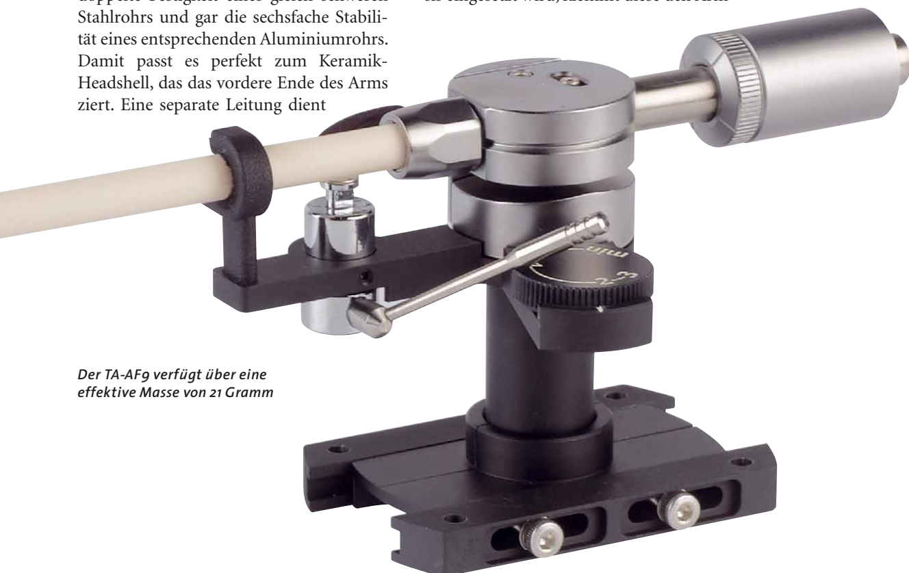
Der TA-AF9 verfügt über eine effektive Masse von 21 Gramm

Natürlich ist der TA-AF9 in der Höhe verstellbar. Wenn er, wie hier, in der SME-Basis eingesetzt wird, klemmt diese den Arm-